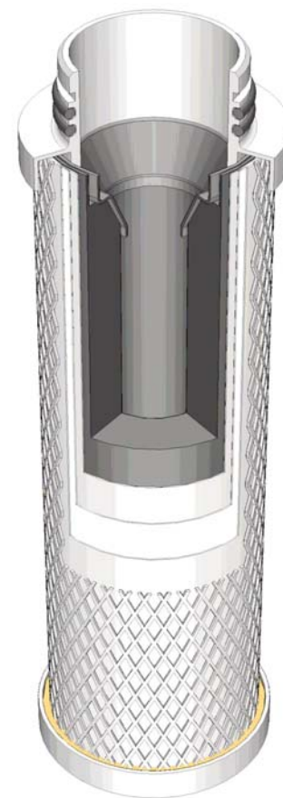
Coupe de l'élément filtrant Ultrac

Avec l'utilisation d'une pré-purification efficace (voir „les recommandations“) une teneur résiduelle en huile de < 0,003 \text{ mg/m}^3 est obtenue.