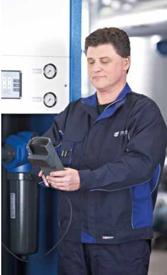
Total Filtration Service für die Druckluftaufbereitung