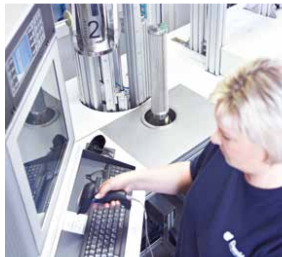
Donaldson bietet eine breite Auswahl an Services

Zur Verbesserung und Ergänzung unseres Außendienstes stellen wir modernste hauseigene Labordienstleistungen zur Verfügung, um Ölaerosole, Ölnebel, Partikelgröße oder -konzentrationen zu überprüfen.