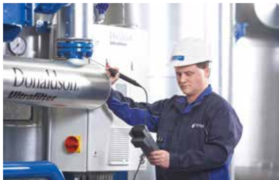
Vorbeugende Wartung verhindert Notrufe