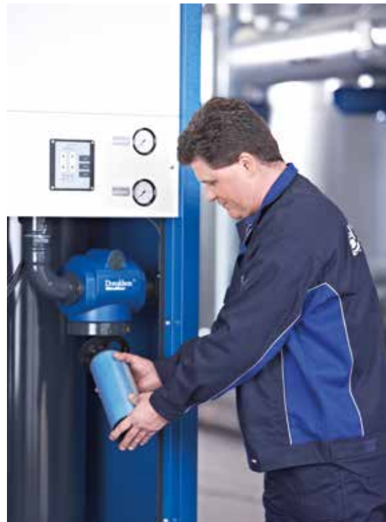
Das Ultra-Filter Gehäuse kann zum Auswechseln des Filterelements einfach geöffnet werden

Donaldson bietet die Serviceleistungen rund um das Druckluftnetz an – die beste Auswahl einzelner Services oder den kompletten Service. Vereinbarungen enthalten verschiedene Wartungsangebote, die so zugeschnitten sind, dass sie Ihren Bedürfnissen und Anforderungen entsprechen.