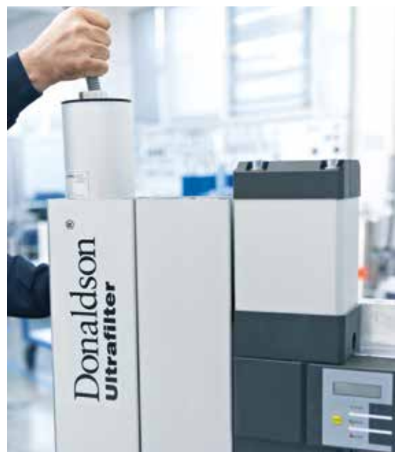
Sauberes und einfaches Auswechseln der Filterkartusche