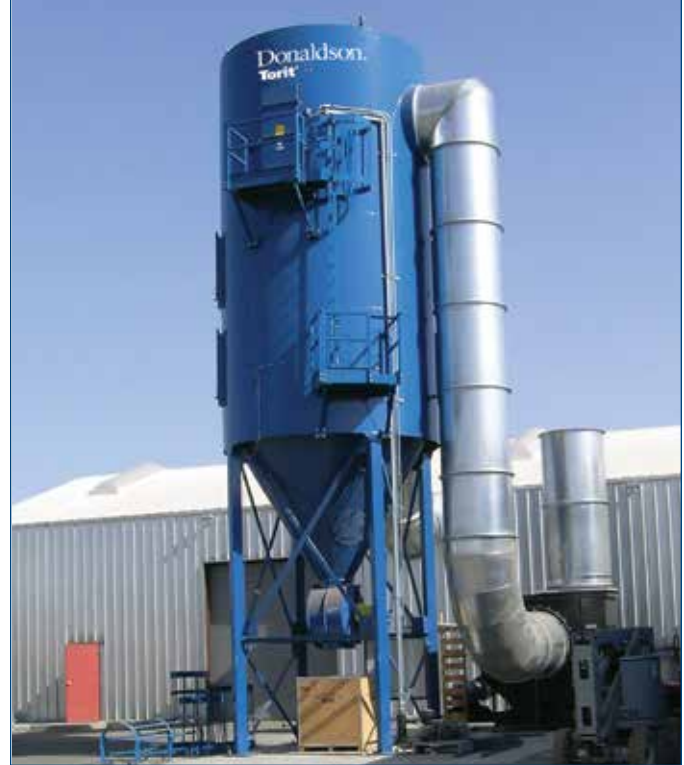
Las bolsas Dura Life en este colector de polvos Donaldson Torit RF proporciona vida más larga y menores emisiones en esta planta de procesamiento de frijol de soya del Medio Oeste

¿Vida de filtro más larga y menores emisiones? Eso es enfrentar al polvo de proteína con fuerza.