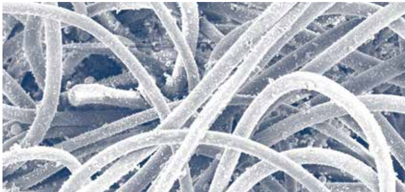
Manga de Poliéster Perforada Lado de Aire Limpio (300x)