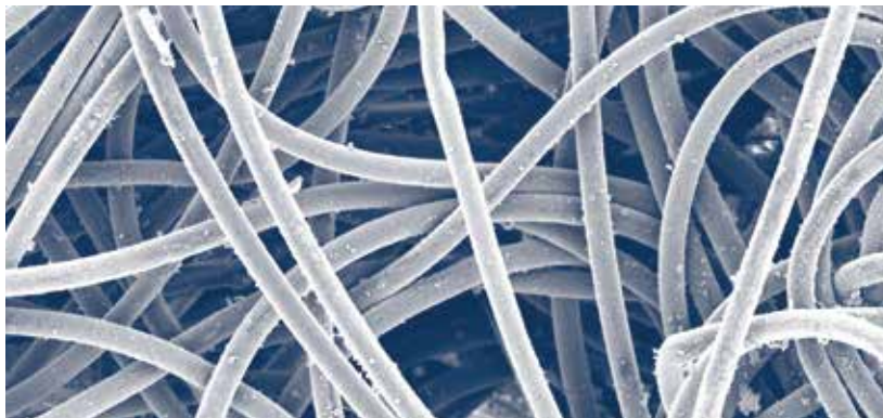
Manga Dura Life Lado de Aire Limpio (300x)

Estas fotos fueron tomadas con un microscopio de lectura de electrones de medio filtrante de manga en un colector que estaba filtrando polvo de ceniza suelta. Las mangas fueron retiradas después de 2,700 horas de uso. La relación Aire – a – medio filtrante fue de 4.5 a 1. La caída de presión después de 2,700 horas de operación fue de 6 in. en mangas de poliéster y 2 in. en Dura Life.