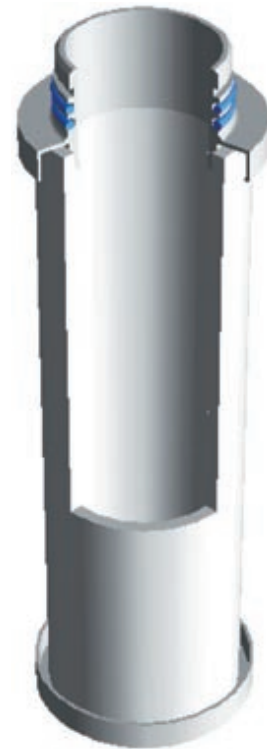
Querschnitt durch den Vorfilter

Unter Ausnutzung verschiedener Filtrationsmechanismen - wie Abscheidung durch Aufprall und Siebeffekt - werden Flüssig- und Festkörperaerosole bis zu 25 µm im Filter zurückgehalten.